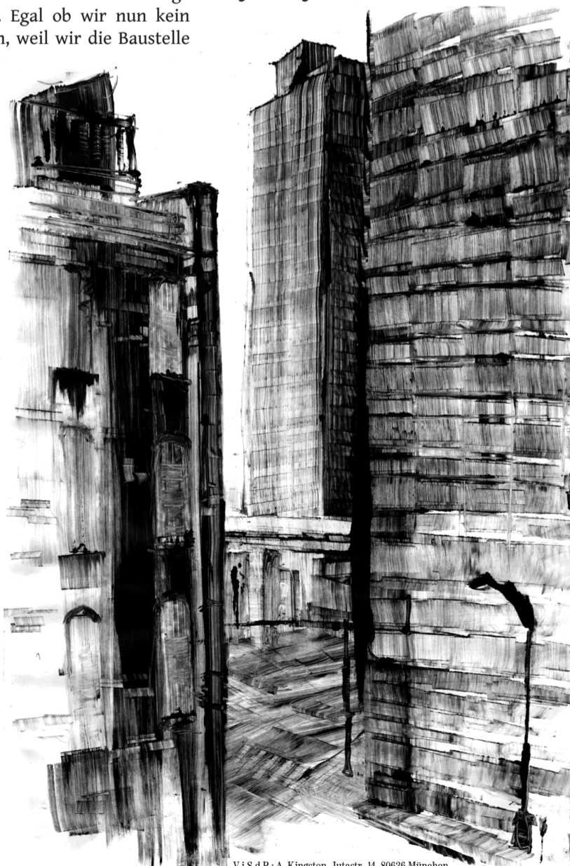
V.i.S.d.P.: A. Kingston, Juttastr. 14, 80636 München

Egal ob sie „mehr Demokratie“, eine „antikapitalistische Gegenmacht aufbauen“, „Alternativen anbieten“ oder gar den „Staat dekonstruieren“ wollen, verwenden die Polit-Aktivisten die selbe Methode: