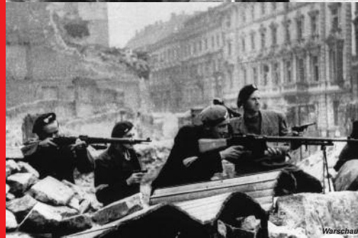
1943/44 Aufstand im Warschauer Ghetto und in Warschau

ges – da haben sie zugleich das ihre getan, einem neuen Weltkrieg der Großmächte zuzuvorkommen. Sie haben das getan, was einzig den Frieden sichern kann: Die Macht denen, die allen Reichtum schaffen! Die Macht den Arbeitern und ihren Verbündeten im Volk! Macht im Interesse der Mehrheit, gegen die Minderheit der Ausbeuter und Kriegstreiber!