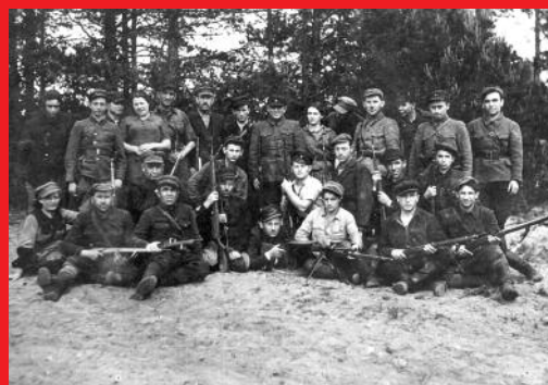
1944 Polen: Naliboki-Wald Partisanen aus verschiedenen Verbänden