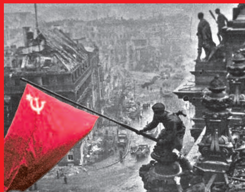
1945 Berlin Reichstag 8. Mai Sieg über den deutschen Faschismus und damit die Befreiung des deutschen Volkes

Ohne den Sozialismus, ohne die Diktatur der Arbeiter in der Sowjetunion wäre der deutsche Faschismus nicht geschlagen worden. Als deswegen nach 1945 Völker beschlossen, nicht andere Herren haben zu wollen sondern keine, als die polnischen Arbeiter sich an den Aufbau Volkspolens machten, als die Arbeiter der Tschechoslowakei statt eines neuen Staats des Kapitals aus den Organen des Widerstands gegen den deutschen Faschismus die Volksdemokratie errichteten, als die Arbeiter im Osten Deutschlands beschlossen: besser zwei Deutschland als die Wiederrichtung des Großdeutschland des Militarismus, des Völkermords und des Krie-