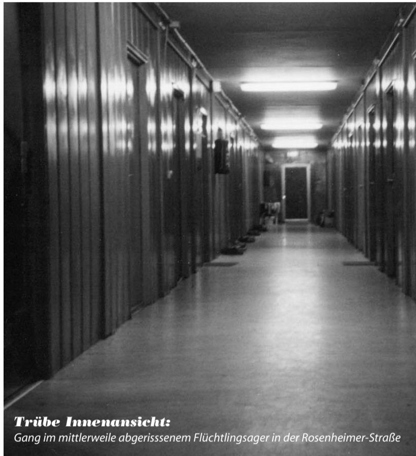
Trübe Innenansicht: Gang im mittlerweile abgerissenen Flüchtlingslager in der Rosenheimer-Straße