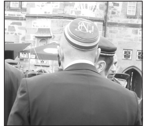
...auf dem Marburger Marktfrühschoppen.

Patriarchale Ideologien sind nicht nur bei der Deutschen Burschenschaft gängige Praxis, sondern ebenso in der gesellschaftlichen Normalität. Denn von einer Überwindung patriarchaler Verhältnisse kann gegenwärtig keine Rede sein: Nach wie vor wird dem männlichen Normalarbeitsverhältnis hinterher getrauert, bei dem der Familienvater für das finanzielle Wohl der Kleinfamilie zu sorgen hat; Reproduktionsarbeit ist noch immer Frauensache. Heteronormativität ist dabei Basis einer gesamtgesellschaftlichen Ordnungsstruktur. Insbesondere der Anti-Abtreibungsparagraph 218 zeigt, wie der Staat über die Körper und die Lebensplanungen von Frauen verfügt und diese gegebenenfalls auch strafrechtlich verfolgt. Auch in der