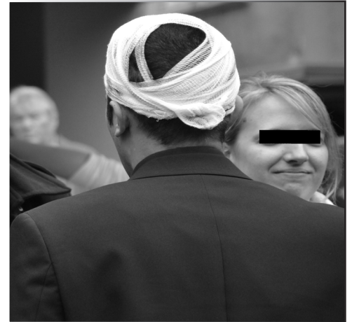
Ein geschlagener Burschschafter verbindet sich