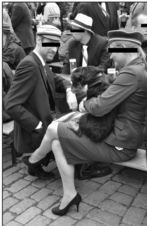
Damenverbindungen - eher kein Hort der Emanzipation

BRUNO: Aber es geht auch um die ganze Vorfeldarbeit... Wir haben Aufrufe geschrieben, Veranstaltungen gemacht, die nicht nur darauf abzielten, irgendwelchen Burschis das Wochenende zu vermießen bzw. tatsächlich die Veranstaltungen zu verhindern. Das haben wir ja auch faktisch nie geschafft. Die Veranstaltungen fanden immer statt und ich find ja trotzdem, dass wir was erreicht haben. In dem Sinne, dass wir halt zusätzlich ne gesellschaftliche Auseinandersetzung mit dem Thema erreicht haben.