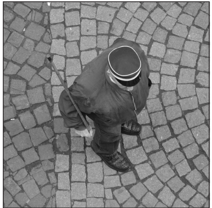
Alter Herr mit Stock: Kaisertreu und deutschnational? Auf jeden Fall bewaffnet

Für 2011 stand die „Aufnahmepraxis im Sinne der BG“ auf dem Programm. Die „Alte Breslauer Burschenschaft der Raczecks zu Bonn“ hatte im Vorfeld des Burschentags 2011 als vorsitzende Burschenschaft der BG einen Antrag auf Ausschluss der Burschenschaft Hansea Mannheim gestellt, da deren