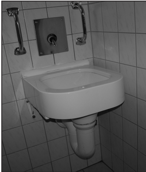
Zum Kotzen: Der sogenannte Bierpapst ist üblicherweise auf Verbindungshäusern installiert

ein vermeintlich luxuriöses Leben in einer Stadtvilla. Annehmlichkeiten wie Reinigungsservice, Bar oder Fernseher mit Pay-TV, all inklusive, sozusagen. Das spricht Fridolin erst mal an und er zieht in das Verbindungshaus der „Burschenschaft Entenhausen zu Leipzig“ ein. Um die ganzen Annehmlichkeiten nutzen zu können, gehört die Teilnahme an regelmäßigen Gesellschaftsabenden inkl. Alkoholkonsum dazu. Das merkt Fridolin schnell und ihm gefällt es anfangs sogar. Erstmal ganz easy und ohne weitere Verpflichtungen, denkt er sich - moralische und gruppen-spezifische Verpflichtungen und Rituale entstehen dennoch bereits an diesem frühen Punkt.