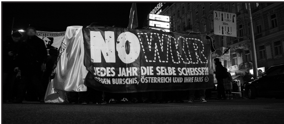
Protest gegen den vhoftentlich letzten WKR-Ball in Wien 2012

weiter verwunderlich, dass von der Betreibergesellschaft der Hofburg keine Auseinandersetzung mit Rassismus, Antisemitismus, Sexismus und „deutscher Herrlichkeit“ stattgefunden hat, ist nicht weiter verwunderlich - dass die eigenen Beschlüsse allerdings so schnell wieder über Bord geworfen werden, verwundert dann schon. Mit der FPÖ als Veranstalterin des Balls zeigt sich hingegen einmal mehr die gut funktionierende Verquickung von Politik und Korporationen in Österreich. Sinnbildlich steht dafür Hans-Christian Strache, der auf dem vermeintlich letzten Ball in der Hofburg aufgrund des deutlichen Gegenwinds davon schwadronierte, dass sie „die neuen Juden“ seien und man sich bei der Anreise zur Hofburg wie bei der „Reichskristallnacht“ gefühlt habe.