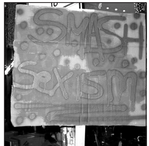
Dagegenhalten! // Foto: smashhomophobia.blogspot.de

Die Deutsche Burschenschaft mit ihrer rechten und explizit patriarchalen Ideologie ist etablierter Bestandteil der Gesellschaft. Wenn in Eisenach die Deutsche Burschenschaft zu ihrem Burschentag zusammenkommt, stellt dies einen Raum propagierter und praktizierter antisemitischer, rassistischer, elitärer, heterosexistischer und nationalistischer Ideologien dar. Solche Handlungen und Auffassungen wollen wir thematisieren und angreifen. Dabei müssen emanzipatorisch denkende und handelnde Menschen den Kontext eines rechten Konsens sowie patriarchaler und kapitalistischer Strukturen innerhalb der Gesellschaft einbeziehen und gemeinsam angehen.