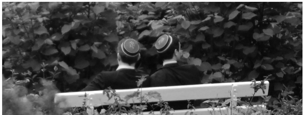
Kuscheln verboten? Per Lebensbund zusammengeschlossene Männer.

GERDA: Rein strategisch macht es aber an einigen Stellen durchaus Sinn, die DB insbesondere über das Nazi-Thema anzugreifen, wenn man ihnen durch Skandalisierung schaden kann, wie das im Laufe des letzten Jahres massiv geschehen ist. Das ist aber selbstverständlich nicht der Weisheit letzter Schluss.