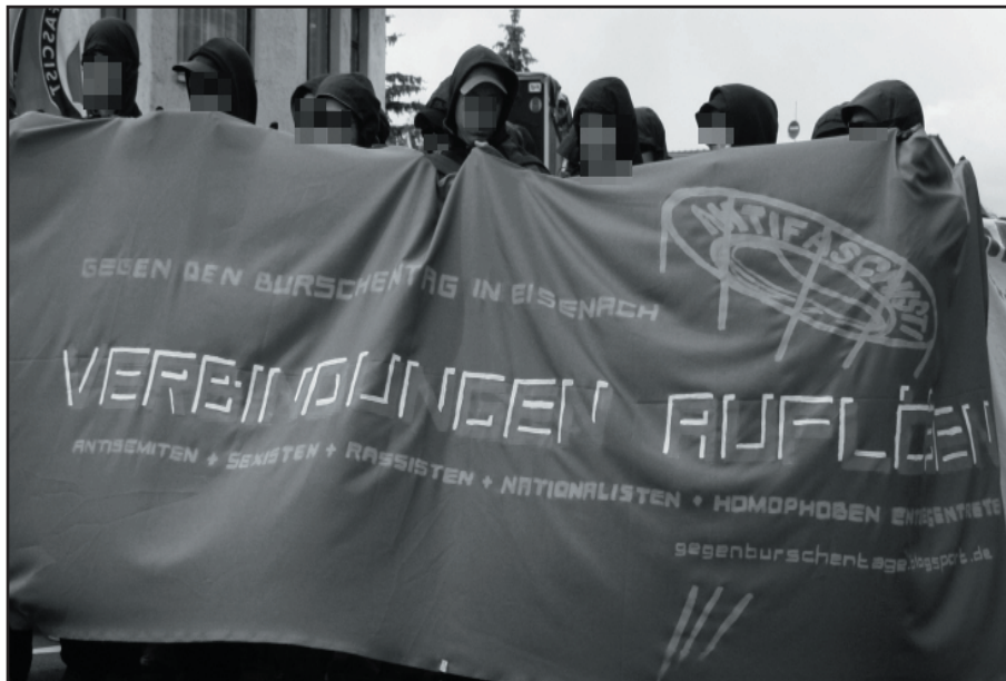
„Verbindungen auflösen“: Die Demo am 18. Juni 2011 in Eisenach

feministisch und antifaschistisch aktive Menschen aus Thüringen, Niedersachsen und Hessen beteiligten sich. Auch die DGB-Jugend Thüringen meldete sich mit einem Grußwort und zeigte sich solidarisch. In Redebeiträgen wurden die zentralen Ideologien der Deutschen Burschenschaft aufgegriffen und kritisiert: Homophobie, Sexismus, Geschichtsrevisionismus, völk-