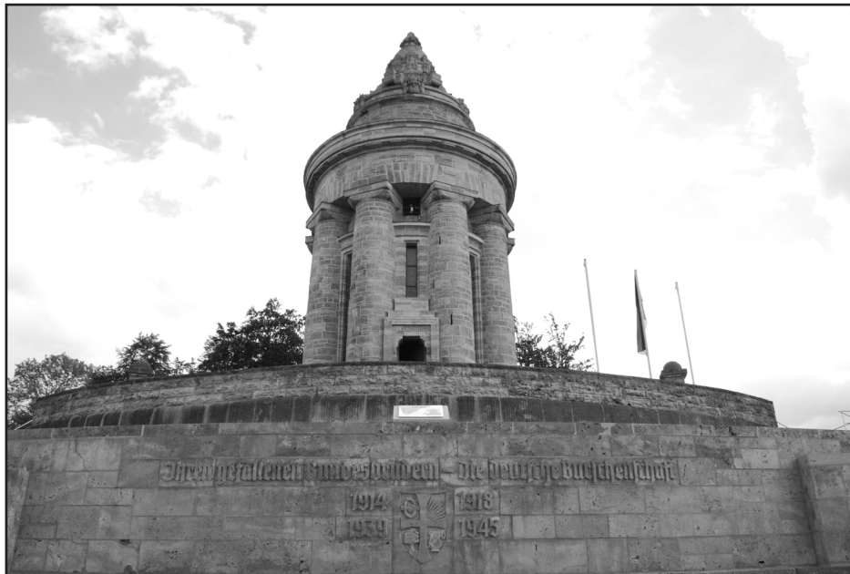
Der alljährliche Fackelmarsch beim Burschantag der DB führt zum Burschenschaftsdenkmal in Eisenach: „Ihren Gefallenen Bundesbrüdern - Die Deutsche Burschenschaft/ 1914-1918 und 1939-1945“