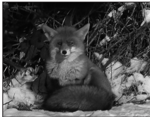
Er kann nichts dafür: Der Rottfuchs

3. Eine Angliederungsphase, in der mittlerweile zum „inaktiven“ Burschen aufgestiegene Student Fridolin aus vielen Pflichten entlassen wird, um sein Studium zu beenden und sich auf den Einstieg in das Berufsleben vorbereiten zu können. Diese Phase endet mit der Aufnahme in die „Altherrenschaft“. Die Phase der Angliederung bezeichnet die „inaktive“ Zeit. Das Studium wird beendet und der Eintritt in das Berufsleben vorbereitet. Je nach Dauer umfasst diese Phase einen Zeitraum von zwei Jahren und mehr. Die „Inaktivität“ des Burschen wird auf Antrag an die Gemeinschaft von dieser auf dem zuständigen „Convent“ beschlossen. Den Abschluss der Inaktivitätszeit bildet die „Philistrierung“, also die förmliche Übernahme des Burschen in die „Altherrenschaft“.