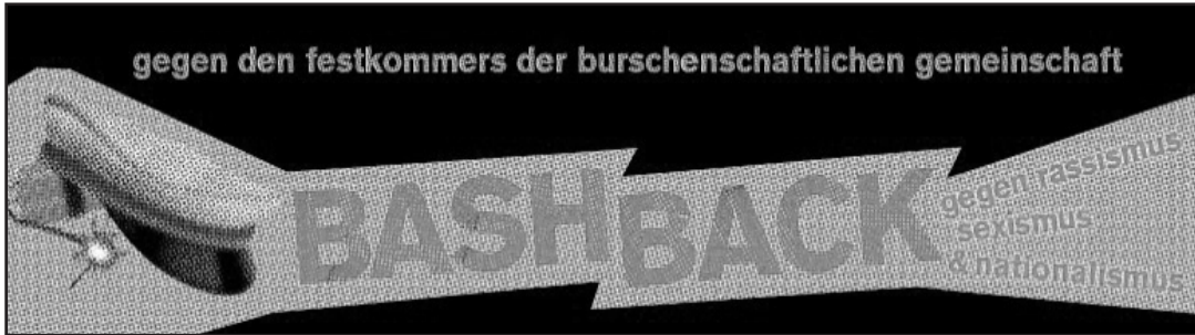
Aufruf zur Demo gegen den Festkommers der BG am 16. Juli 2011 in München: Gemeinsam gegen Rassismus, Sexismus und Nationalismus

die zunehmende Unattraktivität für Studenten, die nicht sowieso schon offen für rechtsradikales Gedankengut sind. Die „Burschenschaftliche Gemeinschaft“ manövriert die „Deutsche Burschenschaft“ in die gesellschaftliche Isolation und politische Irrelevanz - unterstützen wir sie in ihrem Unterfangen!