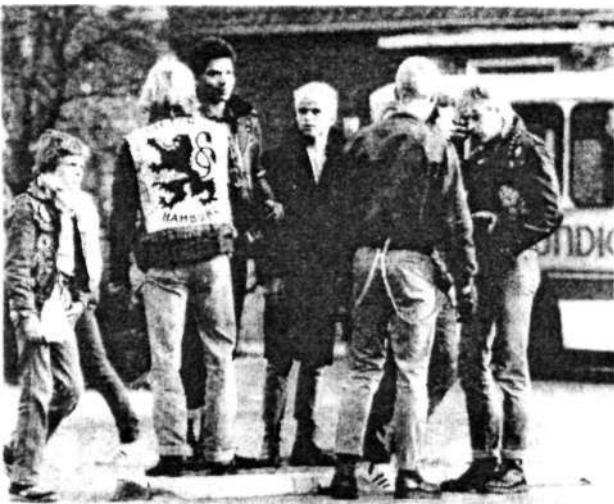
* „Löwen“, Skinheads und Mitglieder der Neonazi-Gruppe Savage Army.

Aus diesen Gruppen bildeten die Aktivisten bald die (neue) Aktionsfront Nationaler Aktivisten in Hamburg und Lübeck.