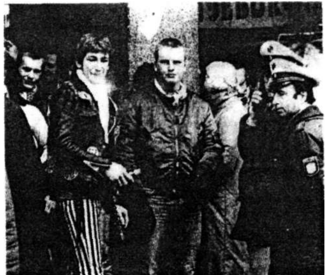
MITGLIEDER DER „BORUSSENFRONT“ während einer NPD-Veranstaltung Ende Februar auf dem Dortmund Markt.