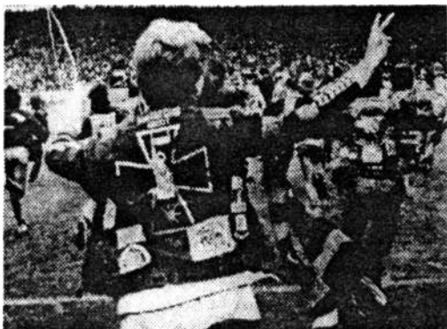
Militaristische Symbole statt Vereinsemlen

Auch Polizei und Justiz tun sich schwer damit, konsequente Maßnahmen gegen die Borussenfront durchzuführen.