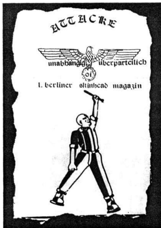
Jungnazi-Publikation Wut auf Türken, Bock auf Hitler