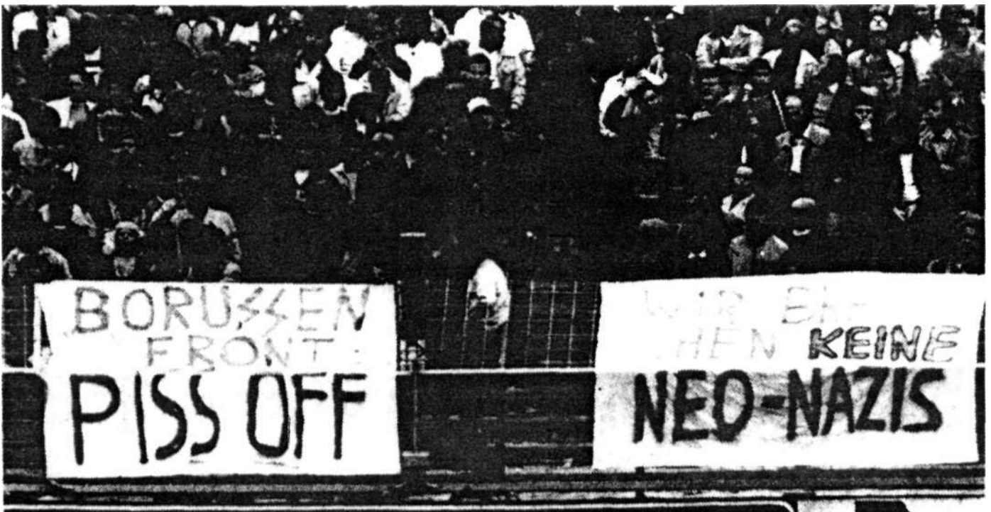
In Leverkusen protestierten Fußball-Fans gegen die Dortmunder Broussenfront

Lothar Matthäus Fußball- Nationalspieler