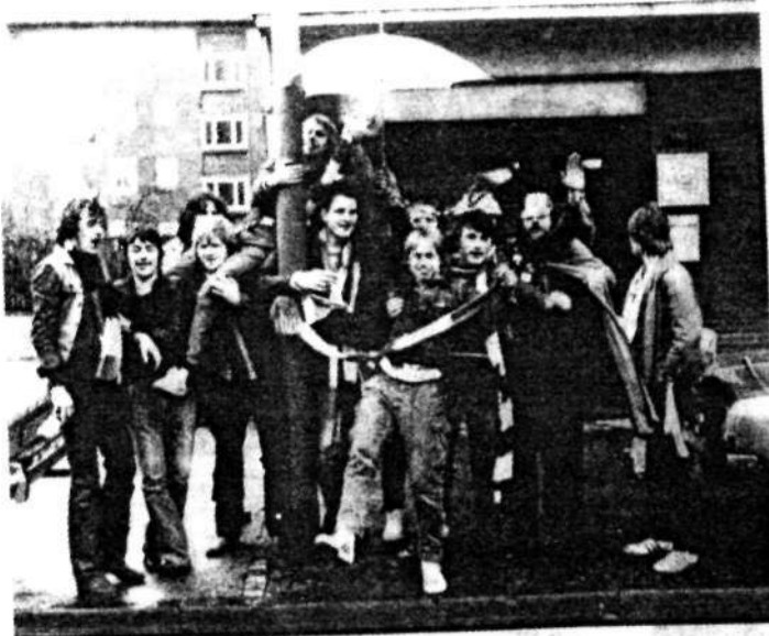
Jugendliche im Dortmunder Norden

Zwei junge Mädchen bekunden uns gegenüber un-verhohlen ihre Sympathie mit der Borussenfront. „Als wir einmal von einer Fete kamen, wurden 'unsere' Jungs von ein paar Türken dumm angequatscht. Da kamen ei-nige Typen von der Borussenfront und haben die fertigm-gemacht. Die haben uns richtig geholfen. Der Großteil von denen ist doch o. k. Nur die 'Brutalen' können wir nicht ab, die immer nur Stunk machen. Unsere Eltern, die haben allerdings Angst vor denen. Wir dürfen des-halb ab 19 Uhr nicht mehr raus. Den Grund wissen sie selbst nicht. Die sagen nur, das und das steht in der Zei-tung und das glauben sie dann auch.“