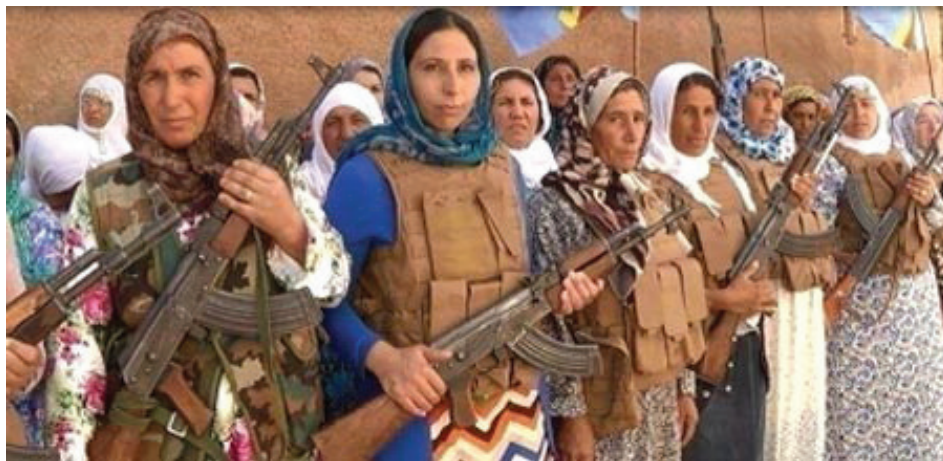
Kurdische Frauenbrigade in Rojava

und der sozialen Freiheit hat, gibt es hier auch einen abweichenden Kurs. Einige wollen sich lieber in klassischen Parteien als in Räten organisieren. Dieses Problem wurde in Rojava durch eine duale Struktur gelöst. Ein Parlament wurde geschaffen, zu dem so schnell wie möglich freie Wahlen unter internationaler Beobachtung stattfinden sollen. Dieses Parlament bildet eine parallele Struktur zu den Räten; es formt eine Übergangsregierung in der alle politischen und sozialen Gruppen repräsentiert sind, während das Rätensystem eine Art Parallel-Parlament bildet. Die Strukturierung und die Regelung dieser Zusammenarbeit werden im Moment diskutiert.“ 3 Diese und andere Fragen zeigen die bare Realität der politischen Situation in Rojava. Es ist unklar ob die Errichtung eines solchen sozialdemokratischen Apparates unter Druck von bestimmten Elementen geschieht, oder ob sie Teil des kurdischen Demokratischen Konföderalismus ist. Während Anarchist*innen auf der ganzen Welt, diese Entwicklung als libertäres Licht in der Region sehen, sollte die