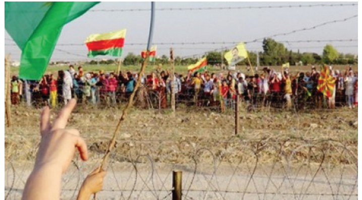
Aufeinandertreffen der Solidaritätskundgebungen mit Bewohner_innen in Rojava.

Rund 160'000 Zelte verteilen sich in der Stadt, voll von Flüchtlingen, die Kobane hinter sich gelassen haben. Die Grenzen zwischen privatem und öffentlichem Bereich sind aufgehoben: Alle Türen in der Stadt stehen offen, alles gehört allen. Alle Häuser der Stadt bieten Flüchtlingen Unterschlupf, selbst die Moscheen wurden zu Nachtlagern umfunktioniert. Tagsüber liest der Imam den Ezan, nachts