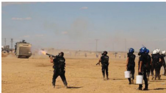
Die türkische Polizei attackiert immer wieder Menschen, die Solidaritätskungebungen durchführen oder über die Grenze nach Rojava möchten.

>> Trotz allem besteht die Region seit nunmehr einem Jahr und erweist sich als stärker, als von allen eingeschätzt. Als der IS in Kobane einmarschierte, gingen alle davon aus, dass die Stadt in wenigen Tagen eingenommen werden würde. <<