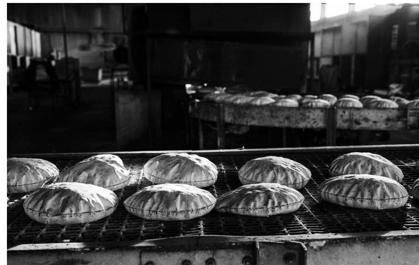
Bäckerei in Qamishli

Was die Telefonkommunikation angeht, ist es so, dass alle Mobiltelefone entweder im Netz der KRG oder der Türkei nutzen, je nachdem wo man sich befindet. Das Festnetz ist unter der Kontrolle der Tev-Dem & der DSV und scheint gut zu funktionieren. Auch dieses ist kostenlos!